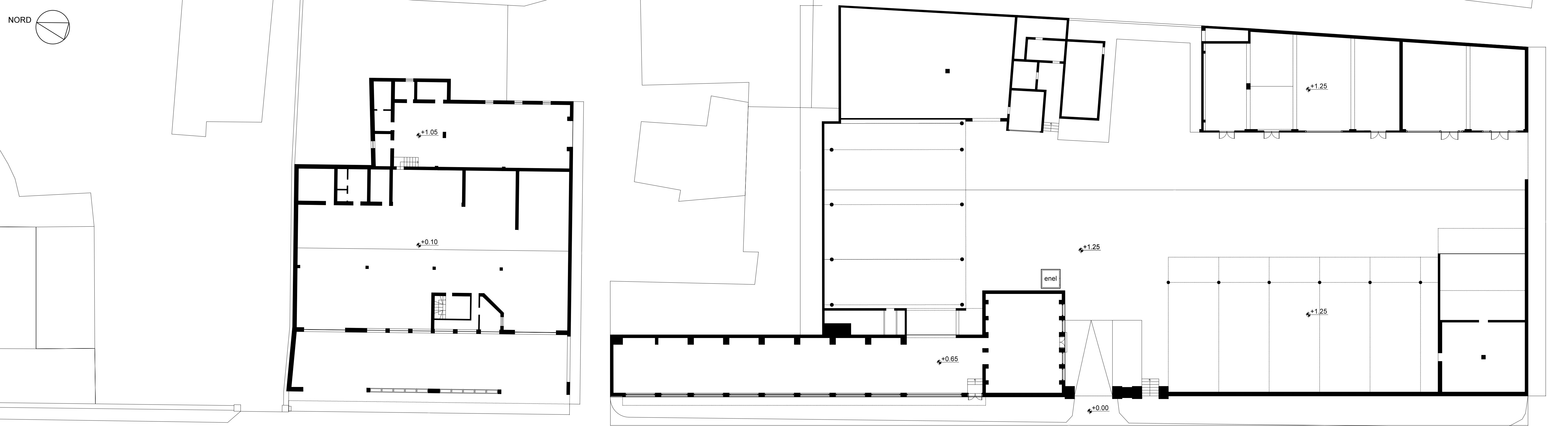
PIANTA PIANO TERRA - RAPP. 1:200