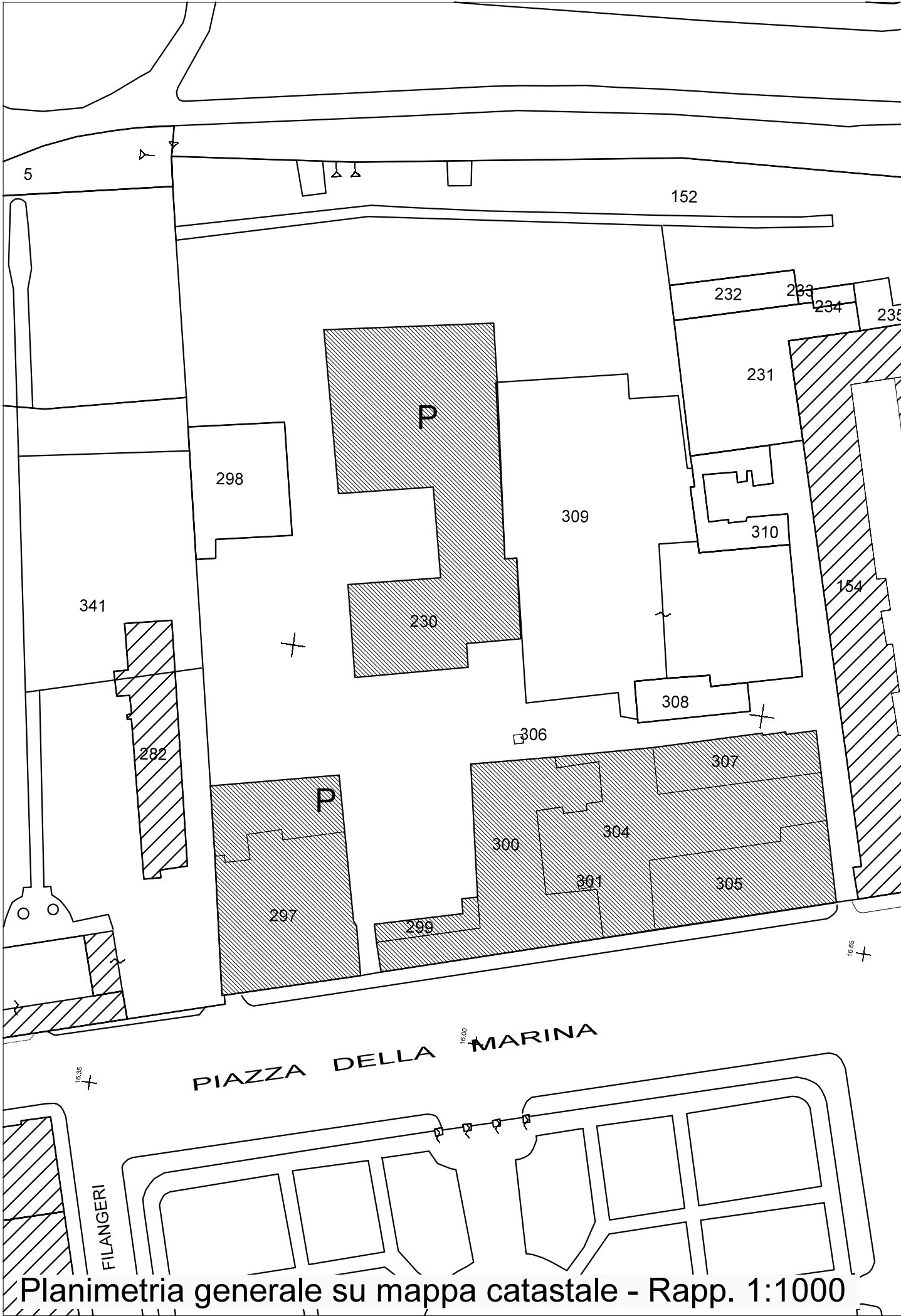
Planimetria generale su mappa catastale - Rapp. 1:1000