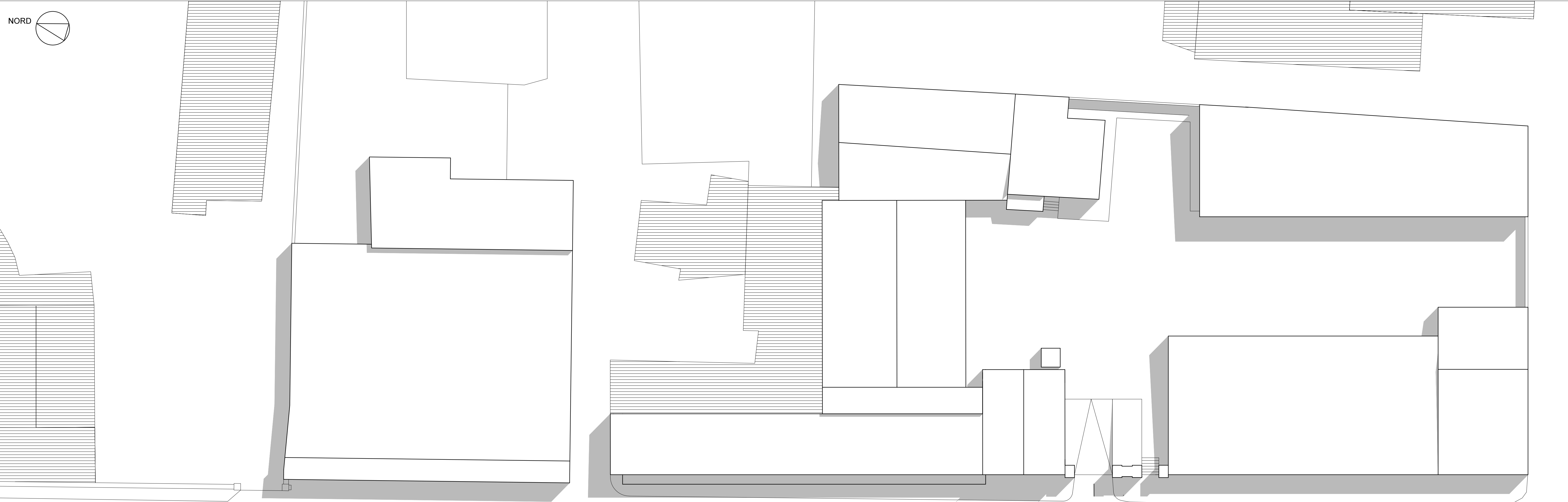
PIANTA COPERTURA - RAPP. 1:200